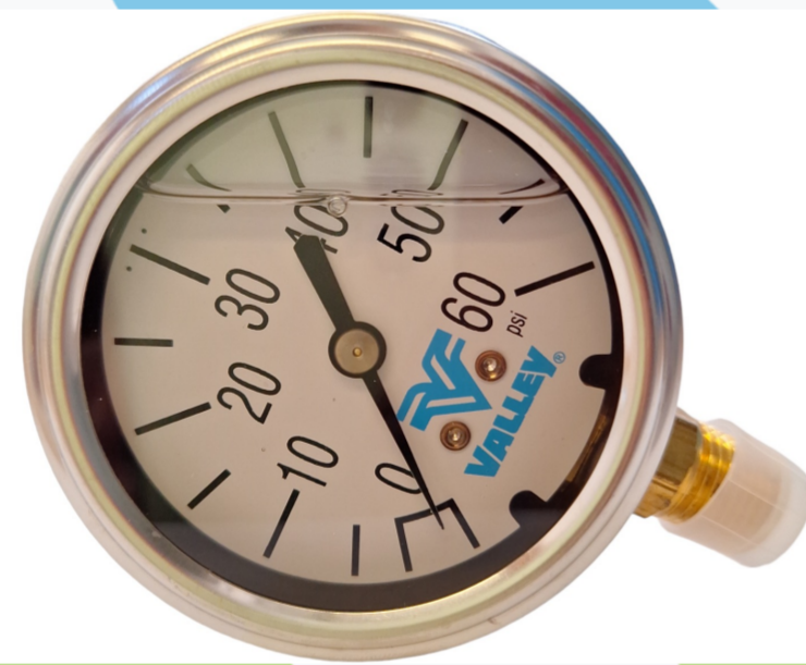
232442 MANOMETRO DE GLISERINA 0-60 PSI