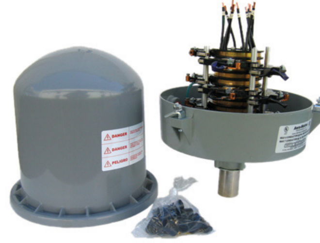
315165 ANILLO COLECTOR 11 COND.