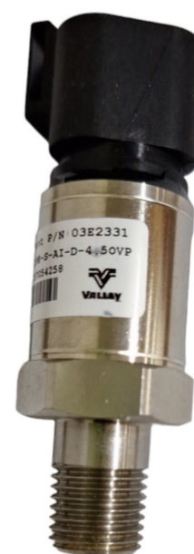
03E2331 TRASDUCER DE PRESION ICON