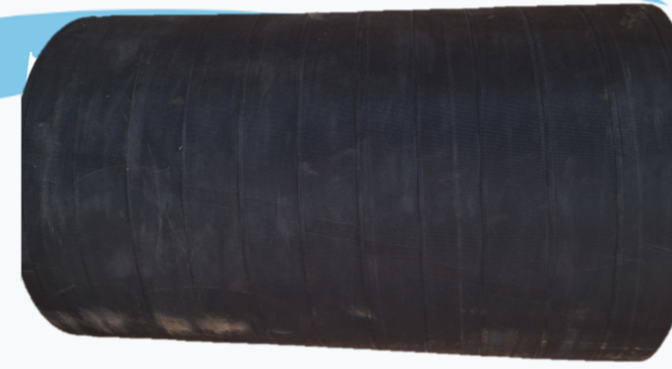
1780265 MANGUERA PARA PIVOFLEX 8" 994520 MANGUERA PARA TRAMO 8 5/8" 1800318 MANGUERA PARA TRAMO 6 5/8"