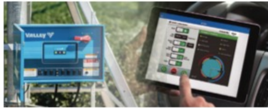
KA02228 ENCODER KIT COMPLETO