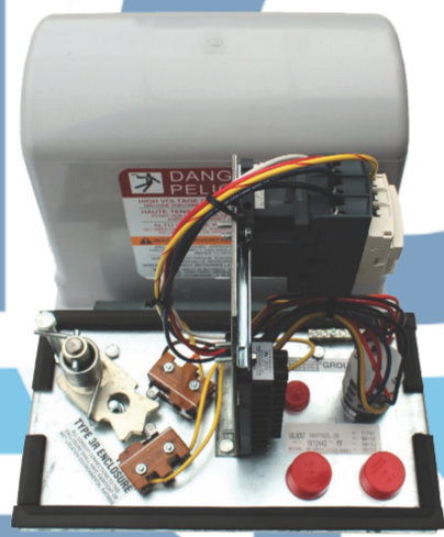
1814235 CAJA MICROS PARA PARO CAÑON Y SIS