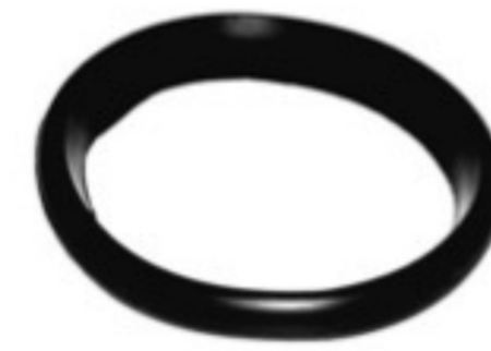
221015 EMPAQUE DE 6" TIPO PIERCE 221001 EMPAQUE DE 8" TIPO PIERCE