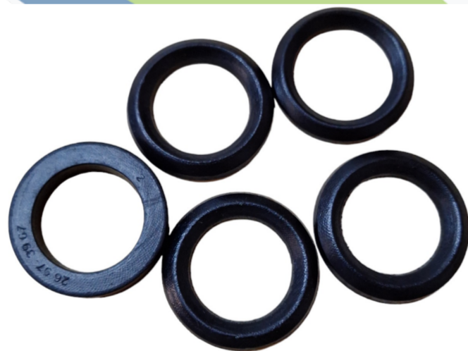
253004 RETENES "V" PARA TUBO "J" DE TUBO SUBIDA AGUA