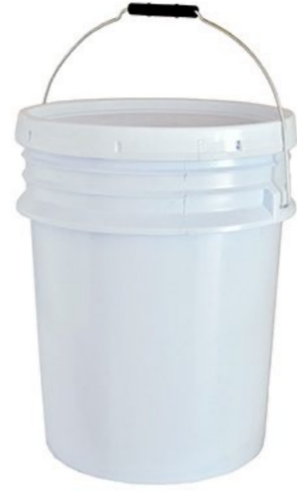
AP98765 ACEITE PARA PIVOTE